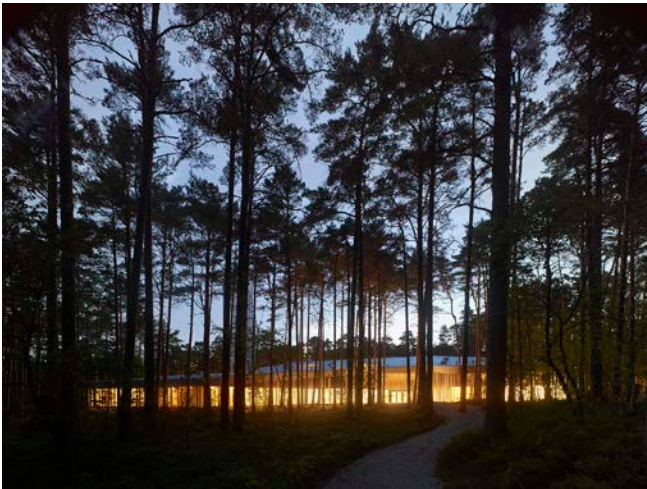
Descripción: Arvo Pärt Centre. Vista exterior