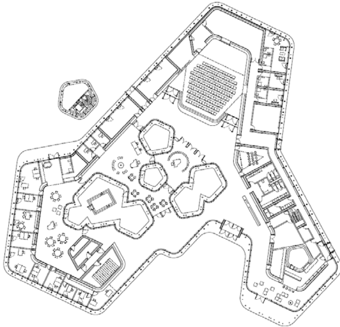
Copyright: © 2018 Nieto Sobejano Arquitectos Descripción: Arvo Pärt Centre. Planta