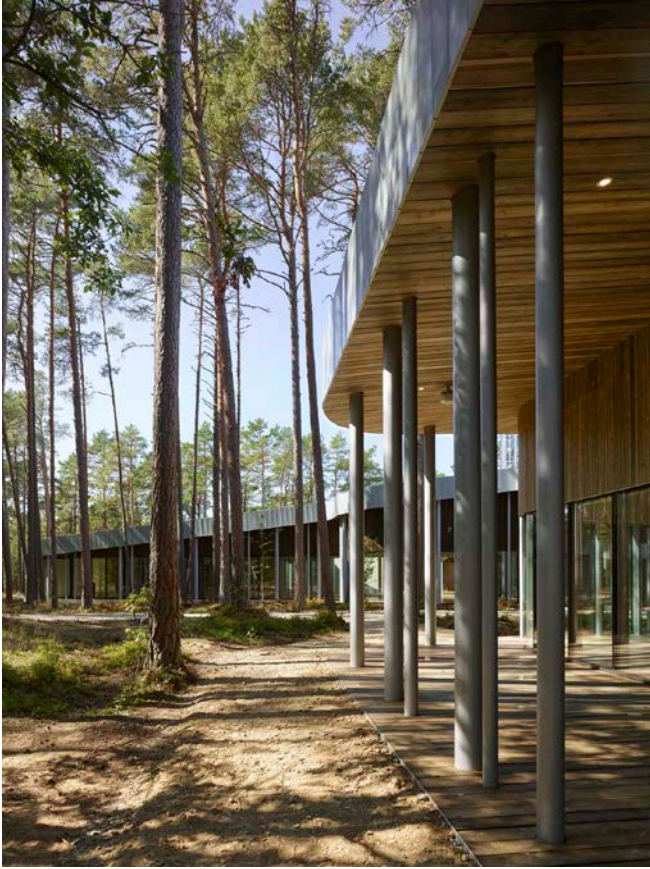
Descripción: Arvo Pärt Centre. Vista exterior