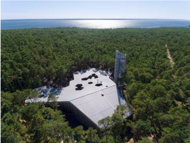
Descripción: Arvo Pärt Centre. Vista aérea

Las siguientes imágenes de prensa pueden ser utilizadas gratuitamente únicamente en publicaciones directamente relacionadas con el proyecto. La información del copyright especificada abajo debe ser incluida en cada imagen. Cualquier otro uso de las mismas está estrictamente prohibido.